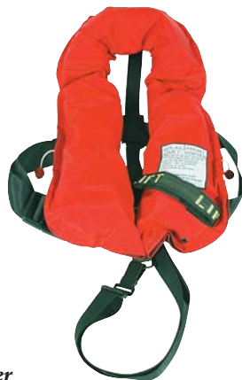
275 N SOLAS godkendt oppustelig redningsvest