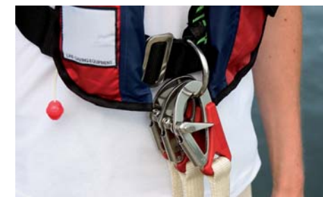
D-ring og livliner

Søsportens Sikkerhedsråd anbefaler, at man til al fritidssejls køber en vest med indbygget sikkerhedssele med D-ring og tilhørende CE-godkendt livline samt skridtrem.