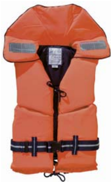
Almindelig fast redningsvest 150 N