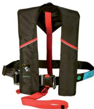
Almindelig 150 N oppustelig redningsvest med integreret sikkerhedssele